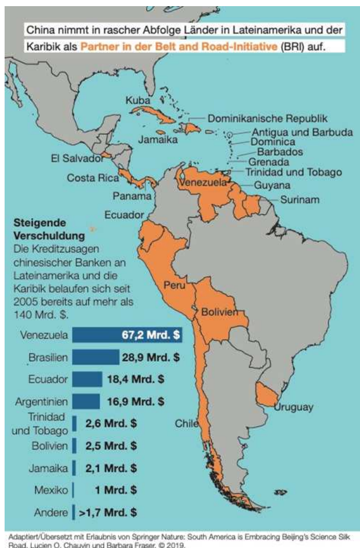
Abb. 1: Partner der „Neuen Seidenstraße“ in Lateinamerika und der Karibik

Das europäische Engagement in Lateinamerika findet somit vor dem Hintergrund und in Reaktion auf die nationalistische Handelspolitik der USA statt, die mittelbar wiederum die Wettbewerbsbedingungen der USA selbst erschweren könnte. Ein weiterer Faktor in dieser komplexen Dynamik ist China: Europa ist nicht der einzige Konkurrent der USA in Lateinamerika, das mittlerweile zu einem weiteren Spielfeld in der globalen Rivalität zwischen den USA und China geworden ist.